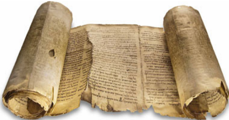
Rouleau de Qumran, découvert en 1947